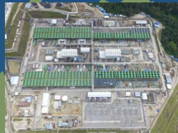
サルーラ地熱発電所 約33万kW (インドネシア) [九州電力他による開発・運営]