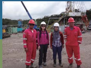
坑井掘削・調査 (インドネシア)