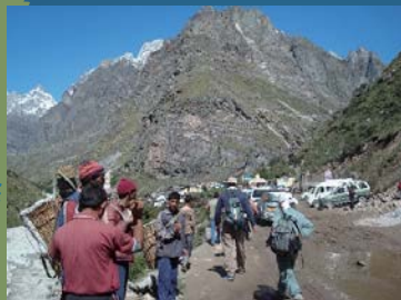
地質・地化学調査 (インド)