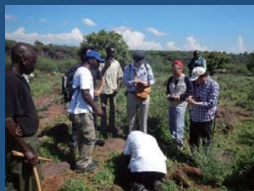
地質・地化学調査 (ケニア)