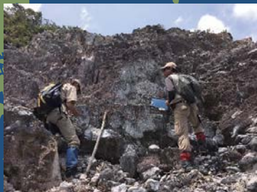
地質調査 (インドネシア)