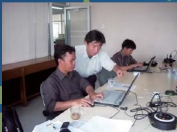
技術指導 (インドネシア)