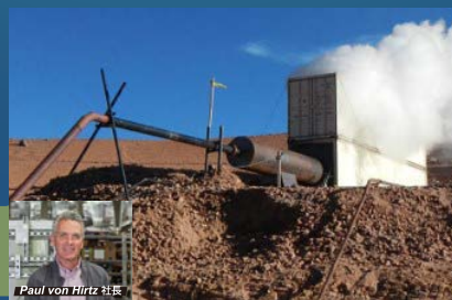
Thermochem as a Kyuden group company since 2020