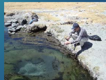
地化学調査 (ペルー)