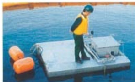
写真 2 現地低圧小型実験装置