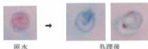
写真3 クリプトスポリジウムオーシスト処理状況。

処理後のオーシストに関してマウス投与試験を行った結果、処理後に、形態的变化が認められなかった群に関しては、発症能力が残存していることが確認された。