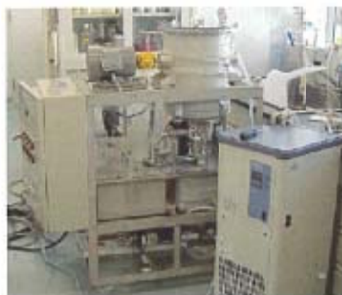
写真 1 高圧室内実験装置

噴射衝撃装置のうち、高圧室内実験装置及び現地低圧小型実験装置を写真 1 に、現地実験装置を写真 2 に、その平面図を図 1 に示す。