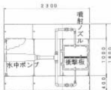
図 1 現地低圧小型実験装置平面図

装置は原水の吸引と加圧を目的としたポンプと、噴射ノズル及び噴射された水流が衝突する衝撃板を基本構造とする。低圧タイプは最大0.5~1.0MPa、高圧タイプは最大11MPaまでの圧力調整が可能である。吸引からノズル噴射にかけての急激な加圧・減圧に、水流の衝撃板衝突時の衝撃が加わり、生物細胞破壊、溶存化学物質変化作用等を生じ、水質浄化を行うものである。非常にシンプルな構造で、全く部品等を使用しない物理的処理法である。アオコの直接的浄化機構の例を図 2 に示す。